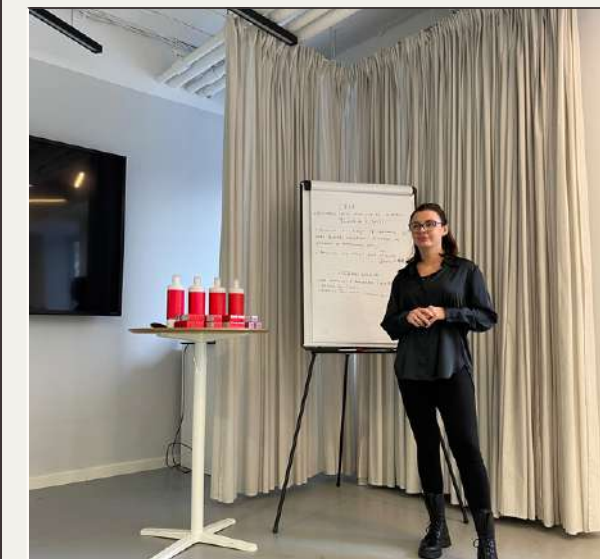
Wsparcie po szkoleniu