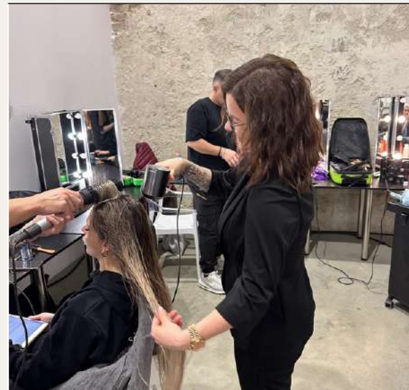
Praca na modelkach